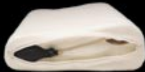
Inflation System / Système de gonflage

Now you can precisely & easily adjust the amount of support your neck requires.