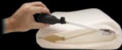
Squeeze Pump / Valve de compression