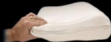
Easy Adjustment / Réglage facile