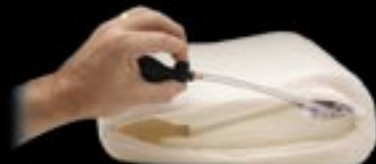
Release Valve / Détendeur de pression